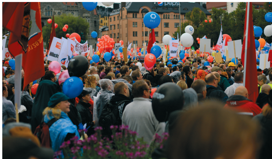
Hallituksen vastainen mielenosoitus Helsingissä 2015.

VASTARINTAKUVA TÄLLÄ PALSTALLA JULKAISTAAN KULUVAN KVARTAALIN VASTARINTAKUVA.